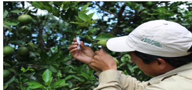
Figura 4. Toma de muestras de psílidos en Rutas urbanas

Entrenamiento: Con el propósito de difundir la estrategia operativa de la Campaña, así como la sensibilización hacia los productores sobre la importancia de la enfermedad y adopción de las acciones mediante el establecimiento de ARCO's, se realizaron 4 Talleres Participativos en los Municipios de Fco. Z. Mena y V. Carranza, correspondientes a la JLSV Sierra Norte; Acateno y Hueytamalco, correspondientes a la JLSV Sierra Nororiental. Con esta acción se benefició un total de 55 productores.