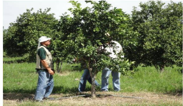
Figura 3. Toma de muestras de psílidos en huertas comerciales