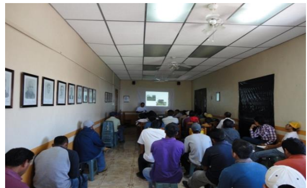
Figura 5. Taller a productores sobre daños y control de Diaforina

Entrenamiento: Con el propósito de difundir la estrategia operativa de la Campaña, así como la sensibilización hacia los productores sobre la importancia de la enfermedad y adopción de las acciones mediante el establecimiento de ARCO's, se realizaron 4 Talleres Participativos en los Municipios de Fco. Z. Mena y V. Carranza, correspondientes a la JLSV Sierra Norte; Acateno y Hueytamalco, correspondientes a la JLSV Sierra Nororiental. Con esta acción se benefició un total de 55 productores.