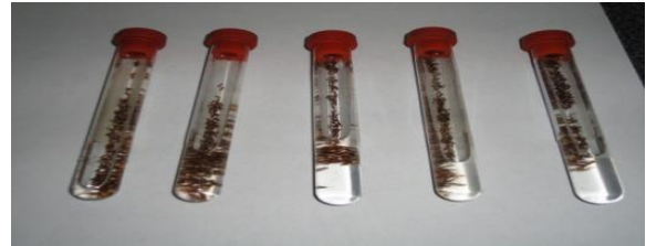
Figura 7. Muestras de psílidos preparadas para su envío a ENECUSAV

Diagnóstico. En materia de diagnóstico se colectaron 213 muestras las cuales se enviaron a ENECUSAV en Querétaro, para su análisis.