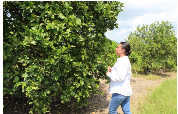
Figura 3. Toma de muestras de psílicos en huertas comerciales