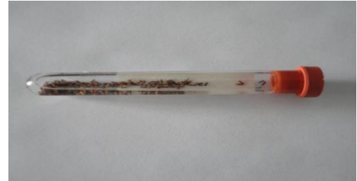
Figura 6. Muestras de psílidos preparadas para su envío a ENECUSAV

Diagnóstico. En materia de diagnóstico se colectaron 195 muestras las cuales se enviaron a ENECUSAV en Querétaro, para su análisis.