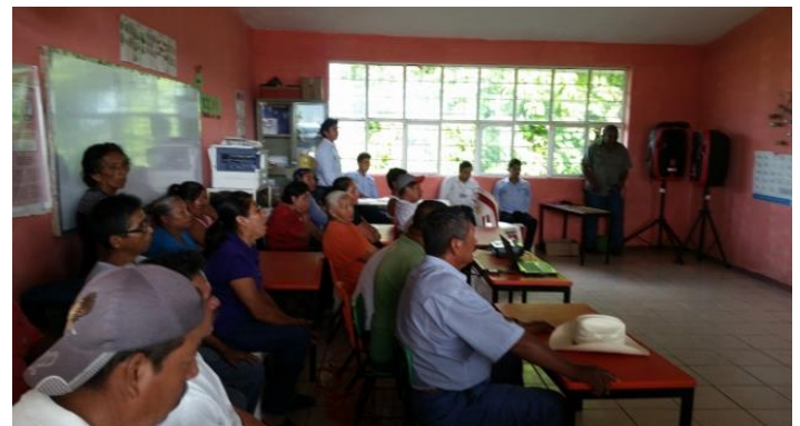
Figura 5. Taller a productores sobre daños y control de Diaforina

Entrenamiento: Con el propósito de difundir la estrategia operativa de la Campaña, así como la sensibilización hacia los productores sobre la importancia de la enfermedad y adopción de las acciones mediante el establecimiento de ARCO's, se realizaron 4 Talleres Participativos en los Municipios de Fco. Z. Mena y Pantepec, correspondientes a la JLSV Sierra Norte; Acateno y Zoquiapan, correspondientes a la JLSV Sierra Nororiental. Con esta acción se benefició un total de 65 productores.