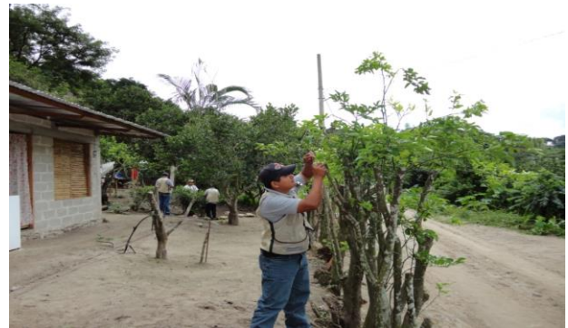
Figura 4. Toma de muestras de psílicos en Rutas urbanas

Entrenamiento: Con el propósito de difundir la estrategia operativa de la Campaña, así como la sensibilización hacia los productores sobre la importancia de la enfermedad y adopción de las acciones mediante el establecimiento de ARCO's, se realizaron 4 Talleres Participativos en los Municipios de Fco. Z. Mena y Pantepec, correspondientes a la JLSV Sierra Norte; Acateno y Zoquiapan, correspondientes a la JLSV Sierra Nororiental. Con esta acción se benefició un total de 65 productores.