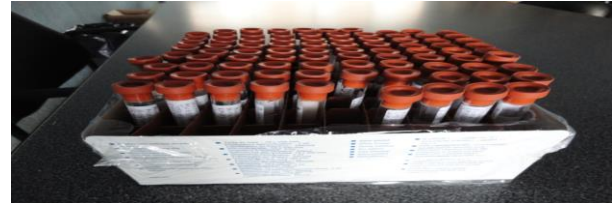
Figura 8. Muestras de psílicos preparadas para su envío a ENECUSAV

f) Diagnóstico. En materia de diagnóstico se colectaron 153 muestras las cuales se enviaron a ENECUSAV en Querétaro, para su análisis.