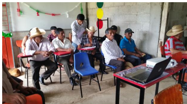
Figura 7. Taller a productores sobre síntomas de plagas reglamentadas de los cítricos y control de diaforina

e) Entrenamiento: Con el propósito de difundir la estrategia operativa de la Campaña, así como la sensibilización hacia los productores sobre la importancia de las enfermedades y adopción de las acciones mediante el establecimiento de AMEFIs, se realizaron 4 Talleres Participativos en los Municipios de Fco. Z. Mena, correspondiente a la JLSV Sierra Norte; Acateno y Ayotoxco de Guerrero, correspondientes a la JLSV Sierra Nororiental. Con esta acción se benefició un total de 58 productores.