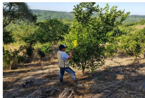
Figura 2. Revisión de trampas durante el monitoreo

Dichas trampas se revisan cada catorce días y se analiza la información en el Sistema de Monitoreo de Diaphorina (SIMDIA), lo anterior para la toma de decisiones de acuerdo al umbral de acción determinado por el Grupo Técnico del Estado.