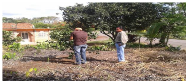
Figura 6. Toma de muestras de psílicos en Rutas urbanas

e) Entrenamiento: Con el propósito de difundir la estrategia operativa de la Campaña, así como la sensibilización hacia los productores sobre la importancia de las enfermedades y adopción de las acciones mediante el establecimiento de AMEFIs, se realizaron 4 Talleres Participativos en los Municipios de Fco. Z. Mena, correspondiente a la JLSV Sierra Norte; Acateno y Ayotoxco de Guerrero, correspondientes a la JLSV Sierra Nororiental. Con esta acción se benefició un total de 58 productores.