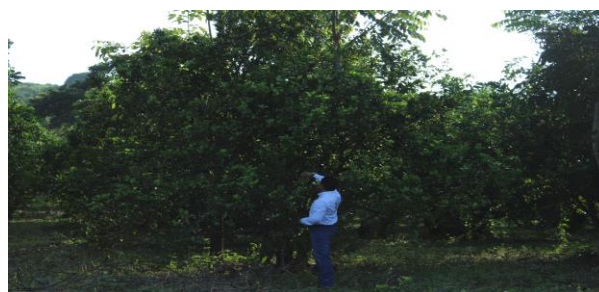
Figura 5. Toma de muestras de psílicos en huertas comerciales