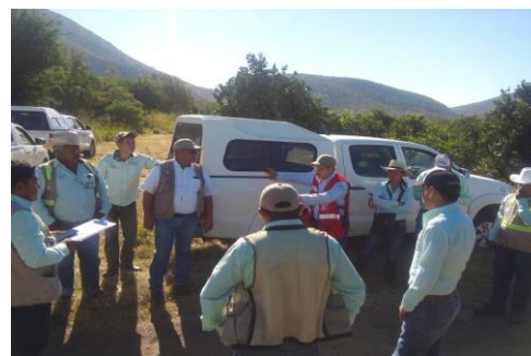
Figura 3. Exploración para detección de síntomas de Leprosis